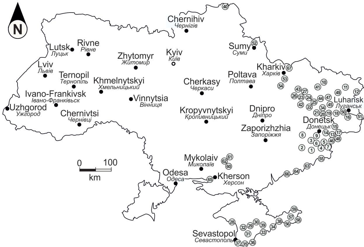
Schematic map of the geographical location of geological sections of the Phanerozoic of Ukraine, inaccessible for scientific research.

Картоschema географічного положення геологічних розрізів фанерозою України, недоступних для наукових досліджень.